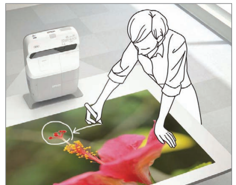
Projecteert op elk horizontaal oppervlak zoals een tafelloppervlak