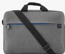
Borsa per notebook HP Prelude da 15,6" 2Z8P4AA