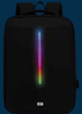
MOCHILA GAMER 500 GAMING BACKPACK 500