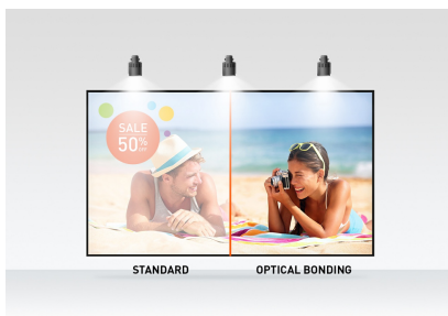
Optical bonded PCAP

Ook verkrijgbaar in het zwart : ProLite T2752MSC-B1