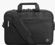
Borsa per laptop HP Professional da 14,1" 500S8AA