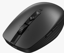
Mouse silenzioso ricaricabile HP 710 6E6F2AA