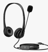
Auriculares estéreo USB HP G2 428H5AA