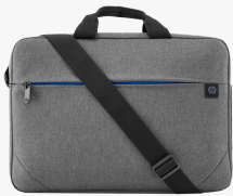
Bolsa para portátil HP Prelude de 15,6 pulgadas 2Z8P4AA