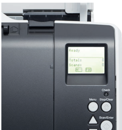
Uitgebreid lcd-bedieningspaneel met geïntegreerde achtergrondverlichting

Dankzij het uitgebreide lcd-scherm met achtergrondverlichting op het bedieningspaneel kunt u informatie zoals scannerinstellingen, de scannerstatus en een papierteller, direct zien. Het is ook heel eenvoudig om via het gebruikerspaneel vooraf gedefinieerde scantaken te selecteren die met de krachtige, geïntegreerde PaperStream Capture-oplossing zijn gemaakt.