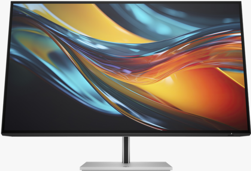
*L'image du produit peut différer du produit réel

Avec l'écran ultra-puissant et extraordinairement précis HP Série 7 Pro 4K Thunderbolt 4 de 31,5 pouces, vous allez en prendre plein les yeux. Exploitez les capacités impressionnantes de Thunderbolt™ 4 pour tout visualiser vos créations avec des détails tangibles et réalistes grâce à la technologie IPS Black et à la CAO résolution UHD 4K 1 .