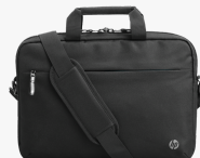
HP Professional -laukku 14,1 tuuman kannettavalle 500S8AA