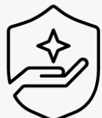
Nouto ja palautus-takuu kolme vuotta U4819E