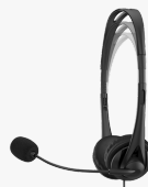
Auriculares estéreo HP de 3,5 mm G2 428H6AA