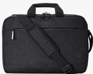
Maletín HP Prelude Pro para portátil de 17,3 pulgadas 3E2P1AA