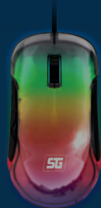
RATÓN GAMER 505 MOUSE GAMER