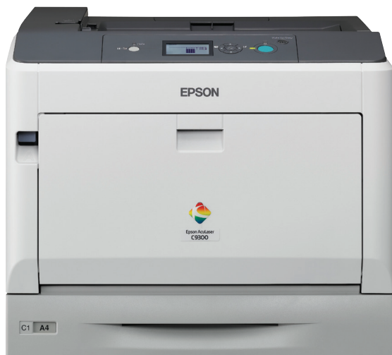
Modell som visas på bilden: AL-C9300N

Den överlägsna A3-färglaserskrivarserien AcuLaser C9300N, med en av de högsta utskriftskvaliteterna i sin klass, erbjuder förstklassiga utskrifter åt företag och mellanstora till stora arbetsgrupper.