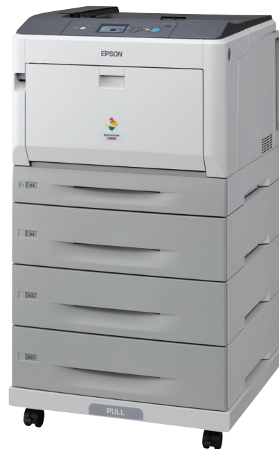
Modell som visas på bilden: AL-C9300D3TNC med duplex, 3 extra pappersfack och ställ