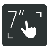
Pantalla táctil de 7 -pulgadas