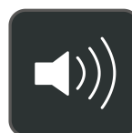
Altavoz de 3W