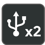
Dos puertos USB