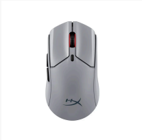
HyperX Pulsefire Haste 2 Pro - Ratón gaming inalámbrico 4K A1KY5AA