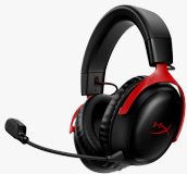
HyperX Cloud III Wireless - Auriculares para juegos 77Z46AA