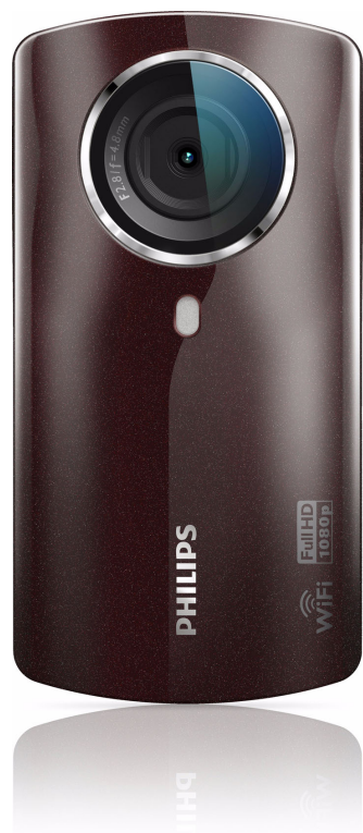
Philips Câmara de filmar HD