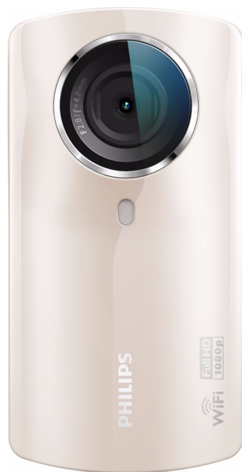
Philips HD videokamera