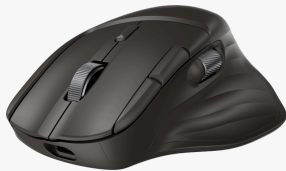
Ratón inalámbrico de desplazamiento ultrarrápido HP 780M BBYX3AA