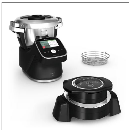
i-Companion Touch Pro avec extension air fryer, Robot cuiseur, 3L, Noir i-Companion Touch Pro avec extension air fryer HF93L8F0

Votre robot cuiseur tout-en-un avec extension air fryer, qui pèse, prépare et cuit tous vos plats !