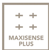
Table de cuisson à induction MaxiSense®Plus pour plus de flexibilité.

La nouvelle table de cuisson à induction MaxiSense® Plus offre plus de flexibilité et de possibilités culinaires. La zone de cuisson s'adapte automatiquement à la taille et à la forme de votre plat pour servir les meilleurs mets.