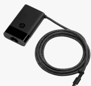
HP USB-C 65W Laptop Charger 671R2AA