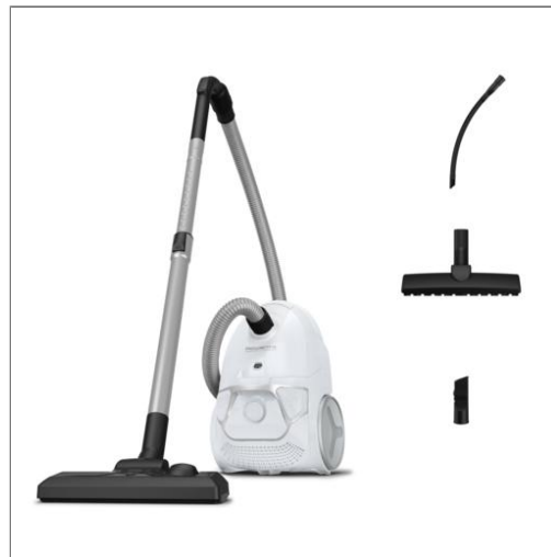
Compact Power Aspirateur avec sac, 900W max, compact, haute filtration, 3L Aspirateur avec sac R03967EA