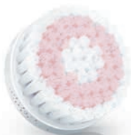
SENSITIVE brush head (SC5991)