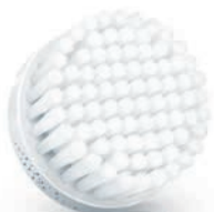
NORMAL brush head (SC5990)