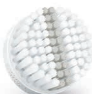
EXFOLIATION brush head (SC5992)