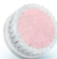
EXTRA SENSITIVE brush head (SC5993)

2 Special needs and care / Necesidades y cuidado especiales / Soins et besoins spécifiques / Necessidades e cuidados especiais / Özel ihtiyaçlar ve destek / العناية الخاصة / نیازها و مراقبت ویژه