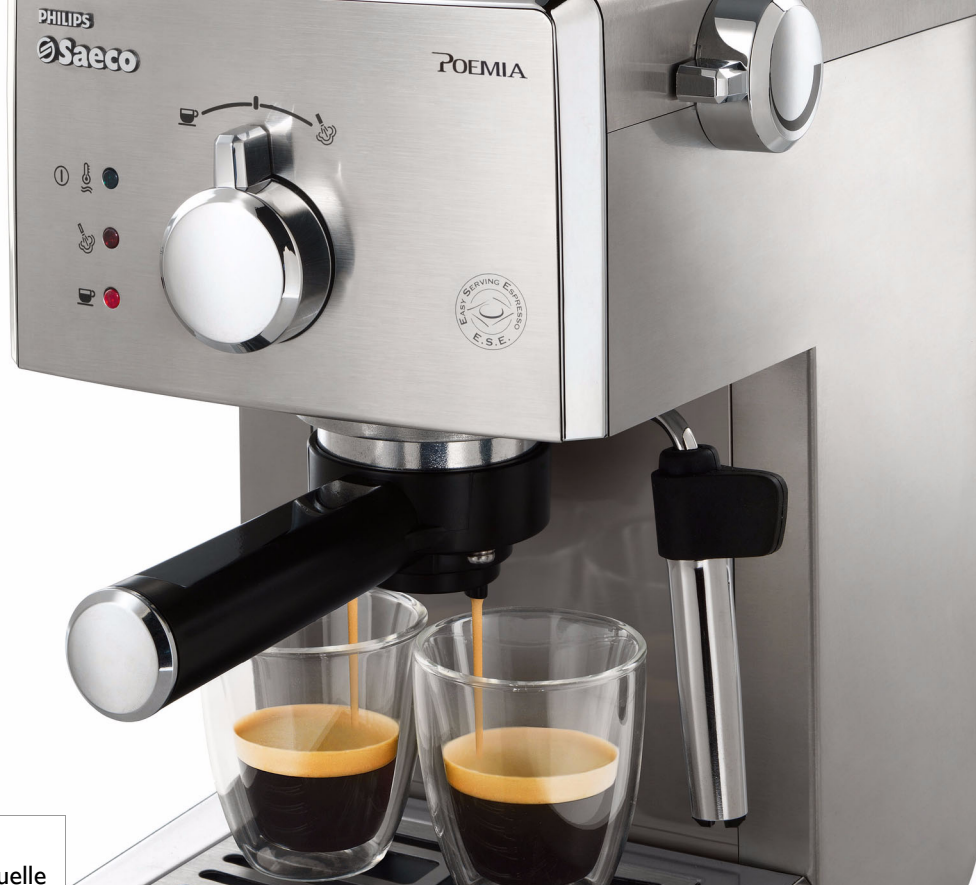
Philips Saeco Poemia Machine espresso manuelle