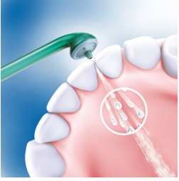
Oro ir mikrolašelių technologija