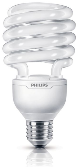
Ampoule spirale fluo-compacte