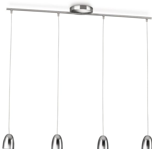
Lampada a sospensione