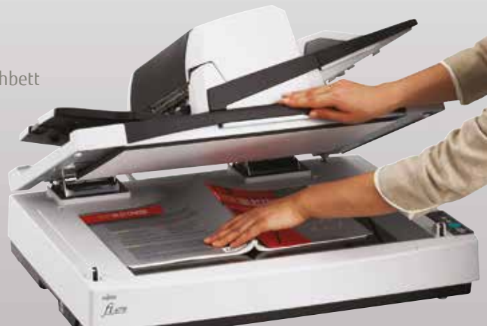
fi-6770 mit Flachbett

Das integrierte Bedienfeld und die LED-Anzeige zeigen auf einen Blick Betriebsstatus und weitere Informationen. Die Scanner fi-6670 und fi-6770 können über USB- oder SCSI-Schnittstellen adressiert und über TWAIN- und ISIS-Treiber gesteuert werden.