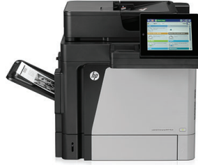
HP LaserJet Enterprise M630dn MFP

Gelişmiş HP Flow çözümleri ile dijital iş akışını kolaylaştıran, güçlü üst düzey güvenlik özellikleri takımı ile iş verileri ile belgeleri koruyan ve kolay, verimli mobil baskı imkanı sunan tam özellikli HP Enterprise Flow MFP'ye güvenin.