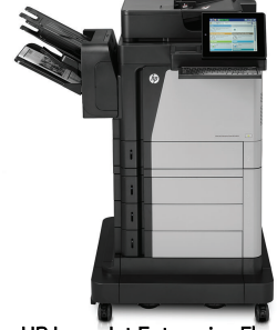
HP LaserJet Enterprise Flow MFP M630z