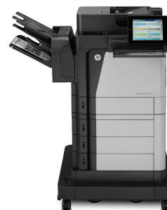
Imprimante multifonction HP LaserJet Enterprise flow M630z