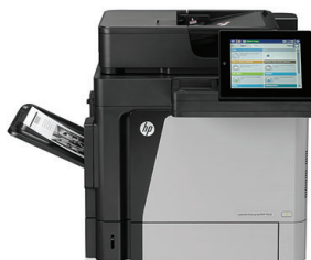
Imprimante multifonction HP LaserJet Enterprise M630dn

Faites confiance à une imprimante multifonction Enterprise Flow HP toute équipée qui simplifie les flux de travail numériques avec des solutions de flux HP avancées, qui protègent vos données professionnelles et vos documents avec une suite solide de fonctions de sécurité de haut vol et qui met à votre disposition une impression mobile simple et efficace.