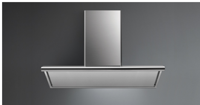
Immagine indicativa del prodotto Potrebbe non corrispondere alla versione selezionata