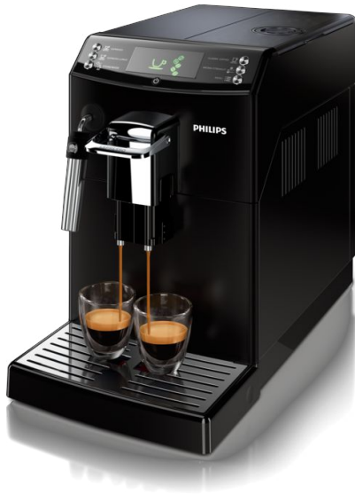
Machine espresso Super Automatique