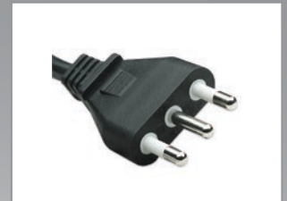
Spina italiana 2P+T 16A

Multipresa, barra di alimentazione installabile a rack; permette di collegare ed alimentare i dispositivi installati all'interno degli armadi 19" destinati a uffici, aziende, sale server, etc.