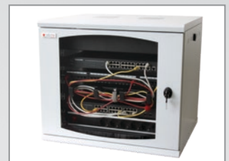
Esempio di Applicazione