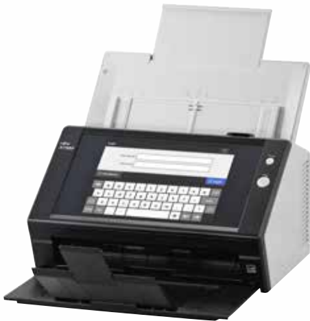
A4-Hochformat mit 300 dpi: 25 Seiten/min bzw. 50 Bilder/min Scannen von gemischten Stapeln bis zu 50 Blatt