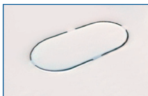
Steriliser with covered heating plate

Philips Avent has made the heating plate visible and easier to clean so you can ensure your steriliser is free from limescale at all times, for an optimum sterilisation cycle.