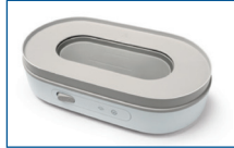
Görünür ısıtma tabanını yeni sterilizatör tasarımı