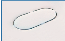
Esterilizador con resistencia cubierta

El proceso de esterilización es extremadamente importante para garantizar la mayor higiene para su bebé. Los restos de cal pueden decelerar el proceso de esterilización e incluso afectar negativamente a su eficacia. Philips Avent ha hecho que la resistencia esté visible y sea más fácil de limpiar, para que pueda asegurarse de que su esterilizador está libre de cal en todo momento, para que el proceso de esterilización sea óptimo.