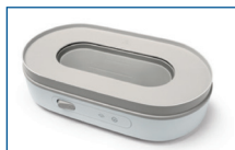
Novo design do esterilizador com placa de aquecimento visível