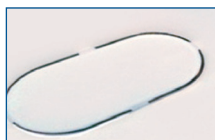
Sterilisator met bedekte verwarmingsplaat

Philips Avent heeft de verwarmingsplaat zichtbaar en gemakkelijker te reinigen gemaakt, zodat uw sterilisator altijd vrij is van kalkaanslag, voor een optimaal sterilisatieproces.