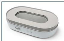
Ny sterilisatormodell med synlig värmeplatta