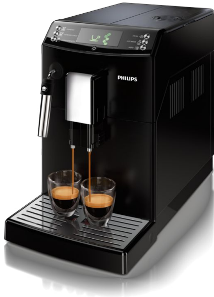
Machine espresso Super Automatique