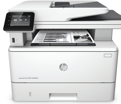
HP LaserJet Pro MFP M426fdn

Hızlı tarama, kopyalama ve faks performansının yanı sıra çalışma biçiminize uygun şekilde tasarlanmış güçlü ve kapsamlı güvenlik. Bu MFP önemli görevleri daha hızlı tamamlamanızı sağlar ve sizi tehditlere karşı korur. 1 JetIntelligence özelliğine sahip Orijinal HP Toner kartuşları size daha fazla sayfa sağlar. 2