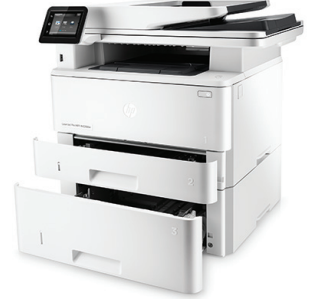
İsteğe bağlı 550 yapraklık kağıt tepsisine sahip HP LaserJet Pro MFP M426fdw