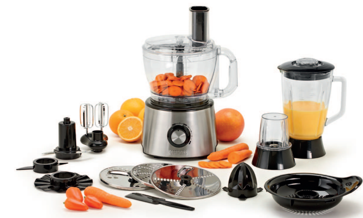
Food Processor 15 in 1 01.220140.01.001

PARTS DESCRIPTION / ONDERDELENBESCHRIJVING / DESCRIPTION DES PIÈCES / TEILEBESCHREIBUNG / DESCRIPCIÓN DE LAS PIEZAS / DESCRIÇÃO DOS COMPONENTES / DESCRIZIONE DELLE PARTI / BESKRIVNING AV DELAR / OPIS CZĘŚCI / POPIS SOUČÁSTÍ / POPIS SOUČASTI