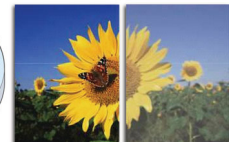
With SmartImage Without SmartImage

SmartImage ist eine exklusive, marktführende Technologie von Philips, die angezeigte Bildinhalte analysiert und Ihnen so eine optimale Anzeigeleistung garantiert. Die benutzerfreundliche Oberfläche ermöglicht Ihnen die Auswahl zahlreicher Modi für Büro, Fotos, Filme, Spiele, Energieeinsparung etc. je nach Anwendung, die Sie gerade nutzen. Basierend auf Ihrer Auswahl optimiert SmartImage Kontrast, Farbsättigung und Schärfe von Bildern und Videos für die ultimative Anzeigeleistung. Der Energiesparmodus ermöglicht einen deutlich reduzierten Energieverbrauch. Und das alles in Echtzeit einfach per Knopfdruck!