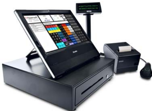
Kassensystem Produktauswahl, Kalkulation