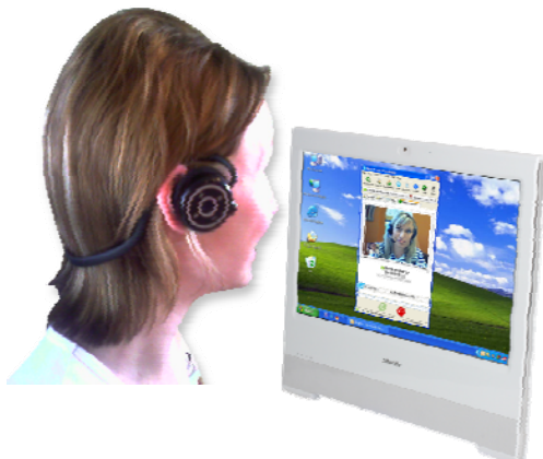
Kommunikation E-Mail, VoIP, Messenger, Blog, Videokonferenz