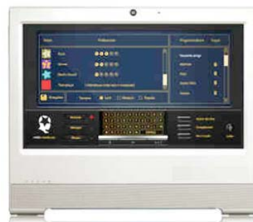
Instore Radio Abspielen von Werbeblendungen und Musik