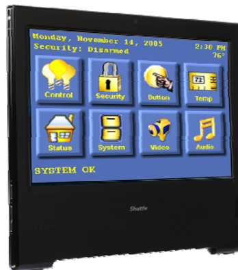
Steuerung Überwachung, Heimautomatisierung, Steuergerät