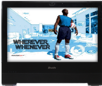
Präsentationen Visuelle Werbepattform am POS, Unterhaltung, Anzeige von Informationen im öffentlichen Bereichen