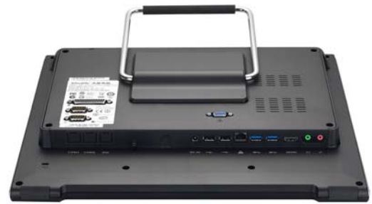
Die Bilder dienen nur zur Illustration.