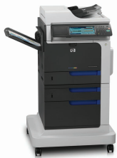
HP Color LaserJet Enterprise CM4540f MFP