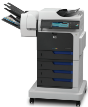
HP Color LaserJet Enterprise CM4540fsm MFP