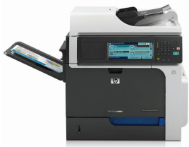
HP Color LaserJet Enterprise CM4540 MFP