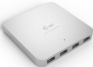
i-tec USB 3.0 Metal Charging HUB 10 Port P/N: U3HUBMETAL10