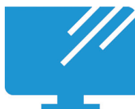
Écran en verre sans bordures