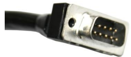
9 Pin D-Sub Anschluss