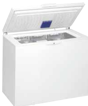
WHE 28333 SURGÉLATEUR COFFRE 6 TH SENSE