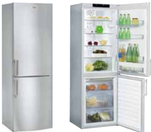
WBE 3325 NF TS RÉFRIGÉRATEUR COMBINÉ NOFROST