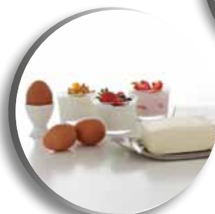
L'espace le plus important sur le marché pour vous produits laitiers 5