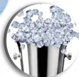
Plus que 100 glaçons par jour 3