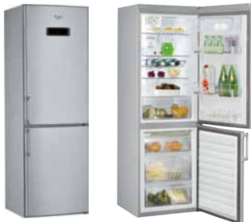
WBE 33772 NFC TS RÉFRIGÉRATEUR COMBINÉ NOFROST 6 TH SENSE FRESH CONTROL