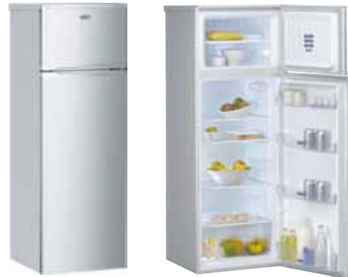
WTE 2511 A+S RÉFRIGÉRATEUR DOUBLE-PORTE