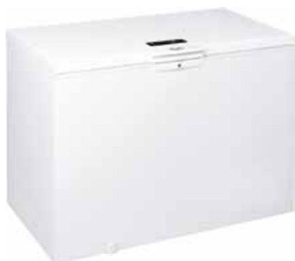
WHE 39332 SURGÉLATEUR COFFRE 6 TH SENSE