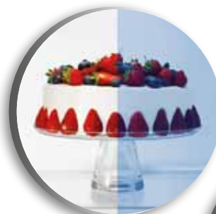
Éclairage LED blanc en comparaison avec le bleu des concurrents