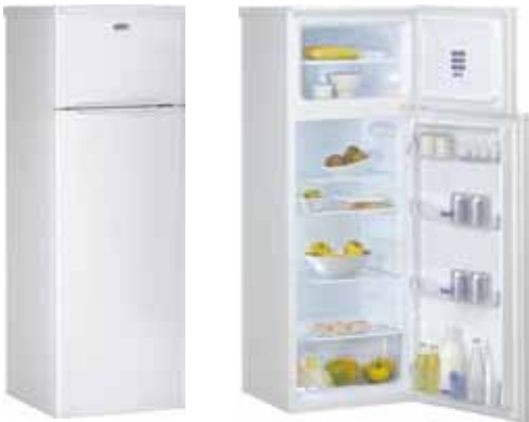
WTE 2511 A+W RÉFRIGÉRATEUR DOUBLE-PORTE