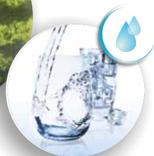
De l'eau à portée de main