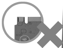
5 PIN - M key