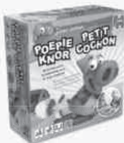
Poepie Knor 18112

Made by Koninklijke Jumbo B.V., part of JumboDiset. Westzijde 184, 1506 EK Zaandam, The Netherlands. © Koninklijke Jumbo B.V., all rights reserved. www.jumbo.eu .