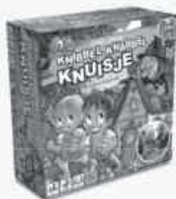
Knibbel Knabbel Knuisje 17962

Ook verkrijgbaar: / Aussi disponible : / Also available: