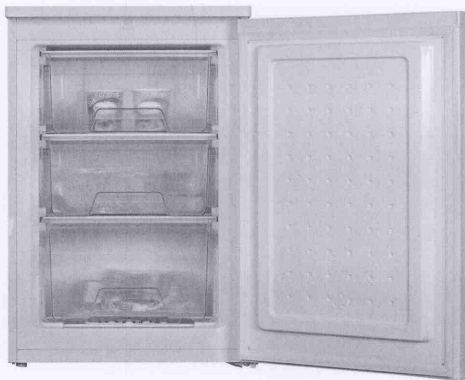
Vriezer WLA VF-5500/5510