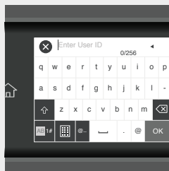
ID y contraseña de usuario