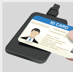
Tarjeta de identificación