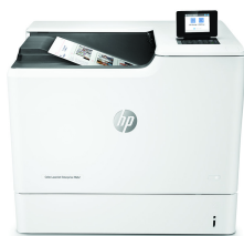
Tiskárna HP Color LaserJet Enterprise M652n

Tiskárna HP Colour LaserJet s technologií JetIntelligence kombinující výjimečný výkon a energetickou účinnost poskytuje dokumenty v profesionální kvalitě, kdykoli je třeba. Zároveň chrání síť pomocí špičkového zabezpečení HP. 1