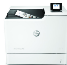
Tiskárna HP Color LaserJet Enterprise M652dn